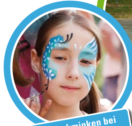
Kinderschminken bei Lebenstraum Immobilien und Reinartz Babyland