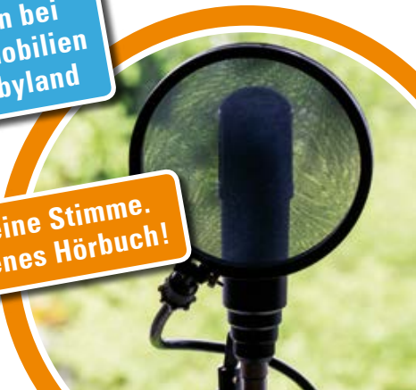
Deine Geschichte. Deine Stimme. Dein Sound. Dein eigenes Hörbuch!