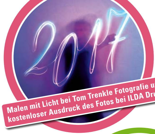
Malen mit Licht bei Tom Trenkle Fotografie und kostenloser Ausdruck des Fotos bei ILDA Druck