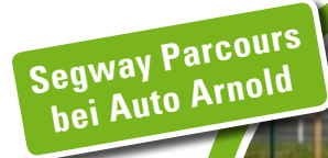
Segway Parcours bei Auto Arnold