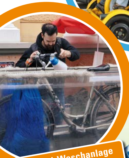
Fahrrad-Waschanlage der Gemeinde Gräfelting

Der Unternehmensverband Gräfelting e.V. wünscht Ihnen viel Spaß und interessante Einblicke!