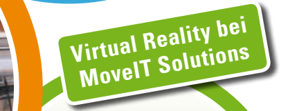
Virtual Reality bei MoveIT Solutions