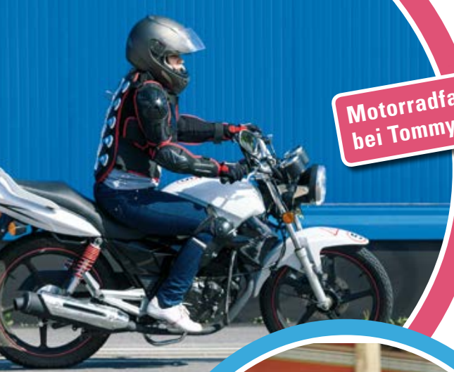
Motorradfahren ohne Führerschein bei Tommy Wagner ab 12/16 Jahren